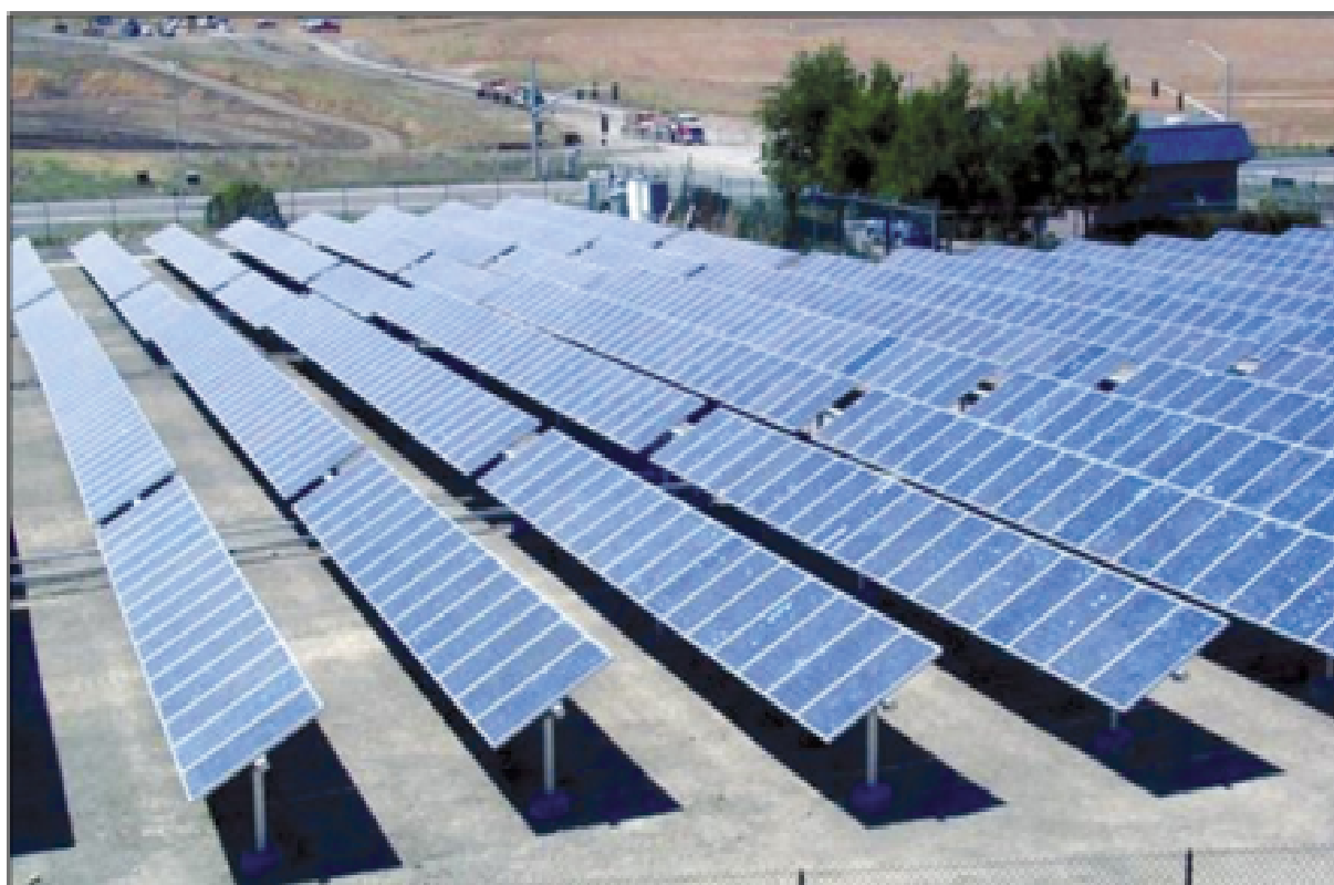
Installazione su suolo

I pannelli possono essere integrati sul tetto o con la struttura portante poggiata sul tetto medesimo o, ancora, messi in posa su di un terreno.